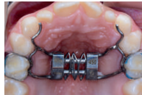
FIN DEL TRATAMIENTO