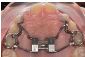
FIN DEL TRATAMIENTO