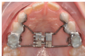
INICIO DEL TRATAMIENTO