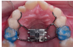
INICIO DEL TRATAMIENTO